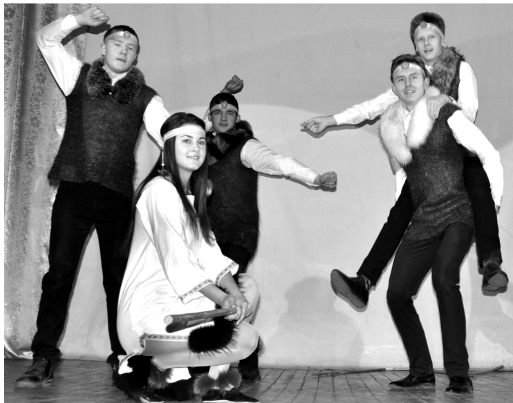
Литературно-музыкальная композиция Кыринской СОШ