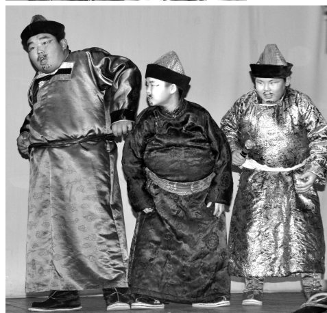
Три номера Тарбальджейской ООШ

Перечислять можно еще долго, скажу одно – все номера, гармонично переплетаясь, сделали концерт незабываемым. И вот наступил волнующий момент подведения итогов и награждения. Среди основных школ третье место заняла Хапчерангинская, второе – Гаванская, первое – Мордойская школа. Гран-при среди основных школ отдало Тарбальджейской ООШ.