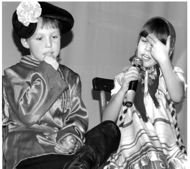
Сценка «Семечки» Мордойской ООШ

Перечислять можно еще долго, скажу одно – все номера, гармонично переплетаясь, сделали концерт незабываемым. И вот наступил волнующий момент подведения итогов и награждения. Среди основных школ третье место заняла Хапчерангинская, второе – Гаванская, первое – Мордойская школа. Гран-при среди основных школ отдало Тарбальджейской ООШ.