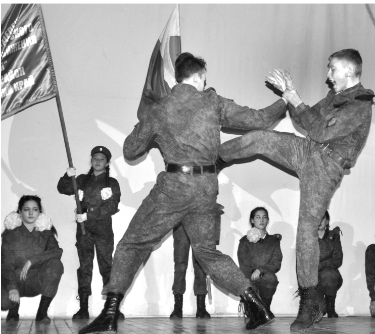
Выступает Мангутская СОШ