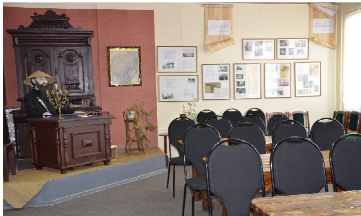
Экспозиция «Научный подвиг Бичурина»

Учредитель - администрация муниципального района «Кыринский район». Главный редактор А.А. СУВОРОВА Газета зарегистрирована Управлением Федеральной службы по надзору в сфере связи, информационных технологий и массовых коммуникаций по Забайкальскому краю. Свидетельство о регистрации СМИ ПИ № ТУ75-00296 от 31.12.2020 г.