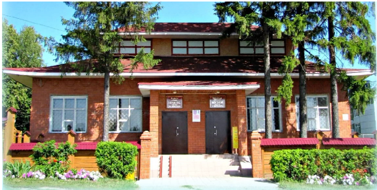
Музей «Бичурин и современность»