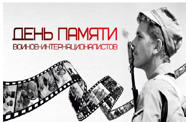
ДЕНЬ ПАМЯТИ ВОИНОВ-ИНТЕРНАЦИОНАЛИСТОВ

В ходе боевых действий на территории Афганистана наши солдаты продемонстрировали бесстрашие, стойкость, высокое военное мастерство, верность товариществу и интернациональной дружбе.