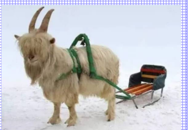
В связи с удорожанием бензина новейшее транспортное средство козлектус sx7

6.10 Х/ф «По секрету всему свету» (12+) 8.00 Местное время. Воскресенье 8.35 «Когда все дома» 9.25 «Утренняя почта» 10.10 «Сто к одному» 11.00, 17.00, 20.00 Вести 11.40 «Большие перемены» 12.40 Х/ф «Незабытая» (16+) 17.50 «Песни от всей души» (12+) 22.00 Москва. Кремль. Путин 22.40 «Воскресный вечер с Владимиром Соловьевым» (12+) 1.30 Д/ф «Мыслители» (12+) 2.20 Х/ф «По секрету всему свету» (12+)