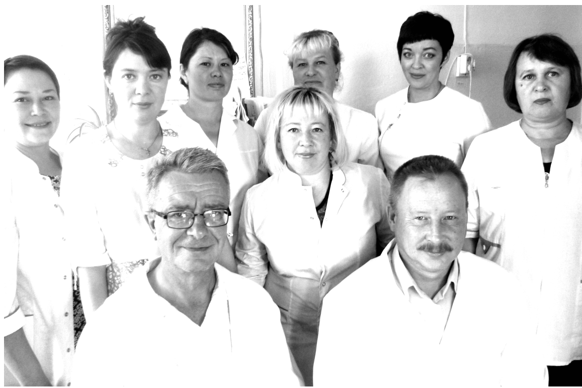
Коллектив отделения анестезиологии и реанимации Кыринской ЦРБ

Древние римляне говаривали: «divinum opus sedare dolorem», что значит «божественное дело — успокаивать человеческую боль». Жители величайшего государства античности знали толк в медицине и уже тогда высоко ценили тех, кого сегодня называют анестезиологами-реаниматологами. Именно на долю этих врачей выпадает благородная миссия — не только спасать жизни, но и избавлять людей от страданий.