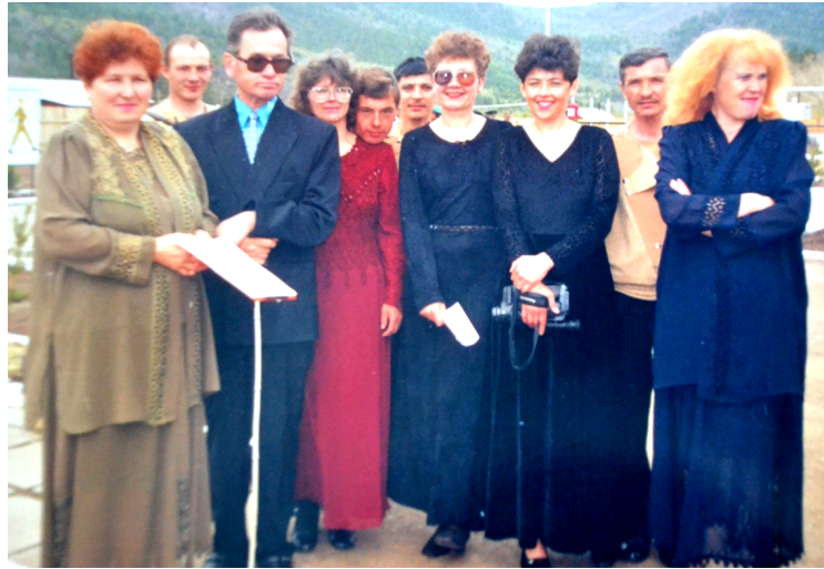
На открытии новой Букукунской заставы, конец 90-х годов