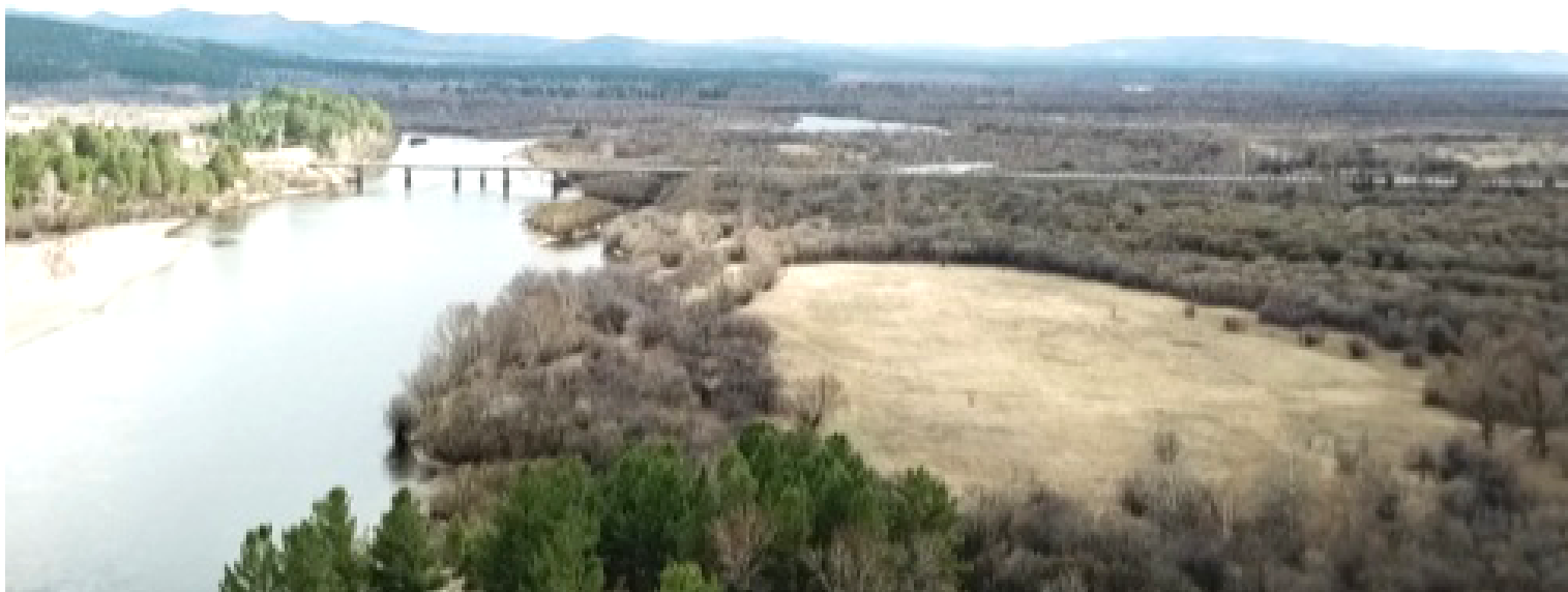
Поляна в правой части снимка – «Старое жилище», место, где находился Верхнеульхунский караул в 1768-1797 годах (даты определены приблизительно)