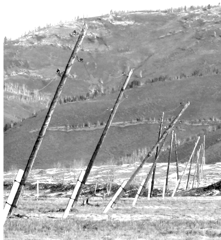
«Пизанские опоры» Хапчеранги

Замечу, что в этот день собрались жители не всей Хапчеранги, а «спецпоселка», расположенного на въезде в село. Там в 50 домах проживает 131 человек, из них 35 детей, трое - груднички. Именно там имеют место эти самые энергетические аномалии. Причем, если днем, в рабочее время, все более или менее работает, то в часы пиковой нагрузки - вечером и в выходные - начинаются аномалии. Внезапно отключаются электроприборы, подпрыгивают холодильники, остывают утюги, а то «спецпоселок» и вовсе погружается во тьму. Что за энергетический разлом нахо-