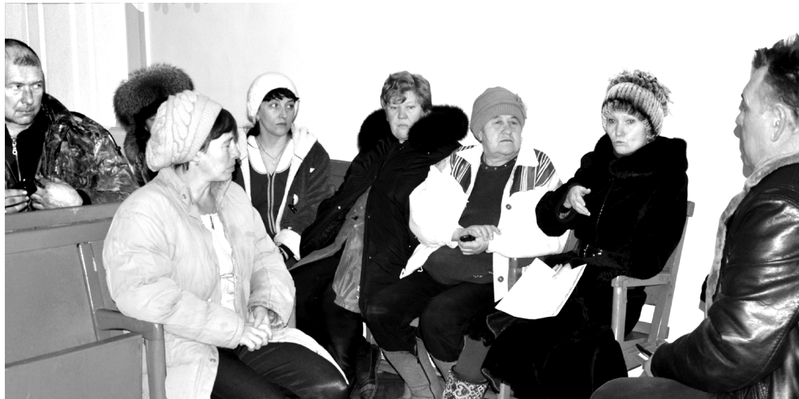
Корреспондент районной газеты на встрече с жителями Хапчеранги в конце декабря 2015 года

Есть у нас в районе село Хапчеранга, которое своим оловодобывающим комбинатом, гремевшим некогда на всю страну, удостоилось упоминания в Большой Советской энциклопедии. Кто не верит, может посмотреть том 28 на букву Х.