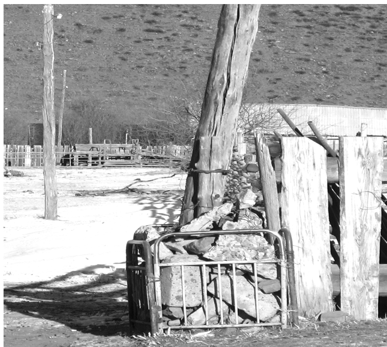
Хапчерангинцы изо всех сил, как могут, подпирают опоры...

ются, холодильники трясет, утюги не хотят нагреваться. Ни сварить, ни постирать, ни погладить, - сетуют другие.