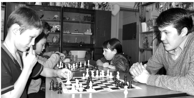
Занятия в шахматном кружке ДДТ