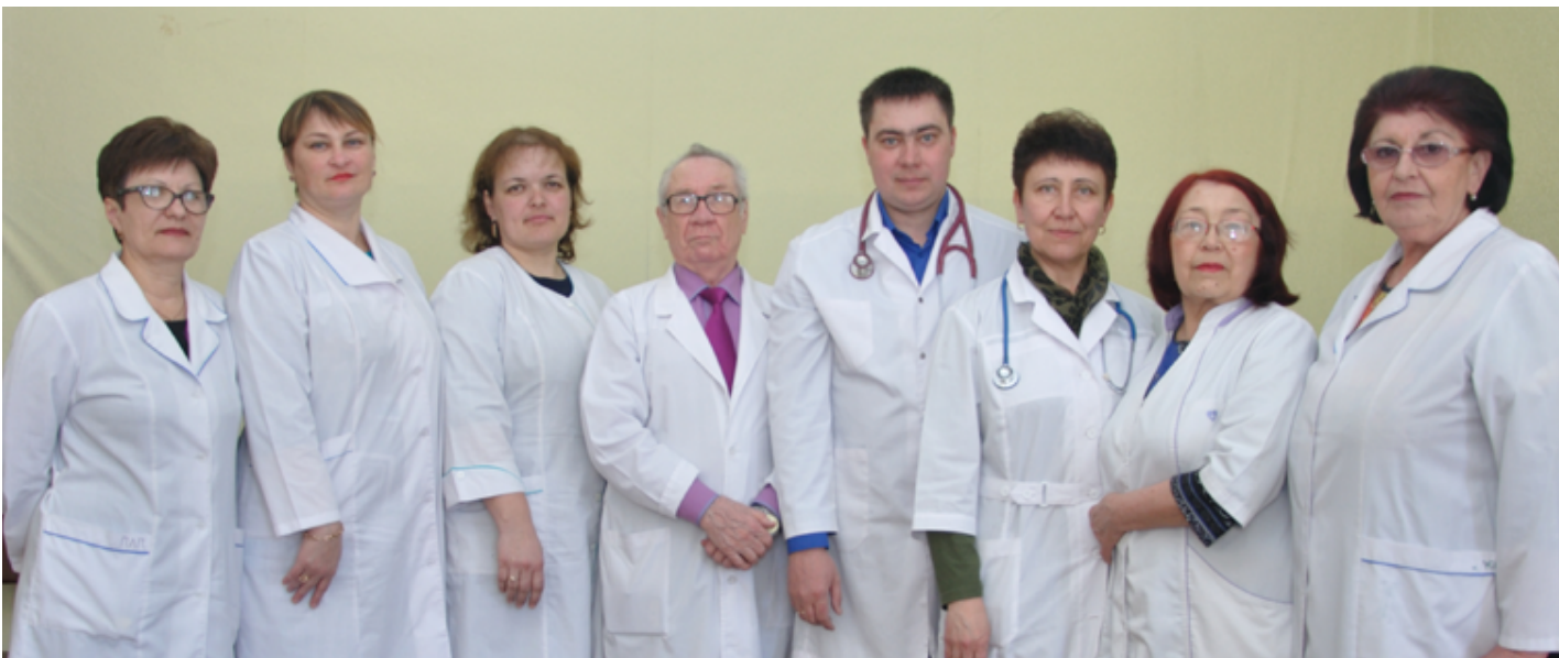
Врачи Кыринской центральной районной больницы

С уважением, Совет и администрация СП «Кыринское»