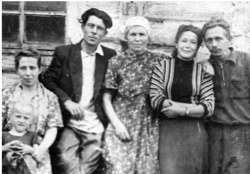
Жители села Ашинга. 1956 год