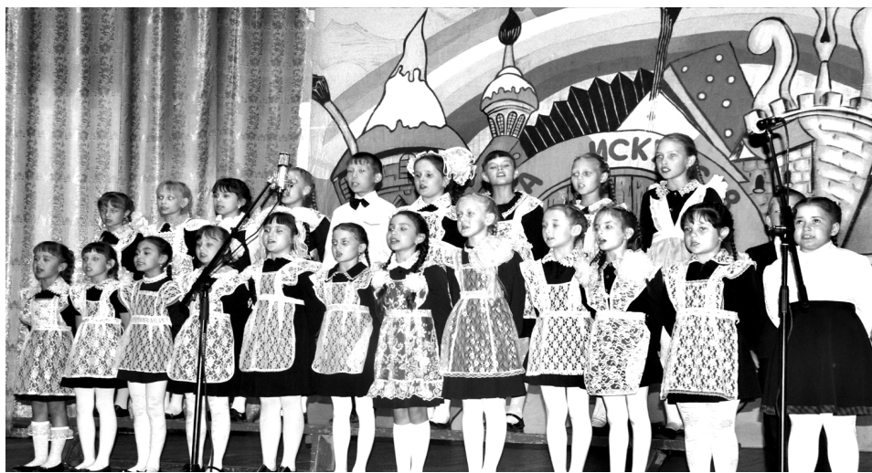
Хор младших классов