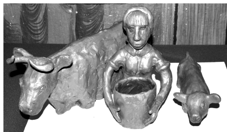
Скульптуры Ольги Москалевой...