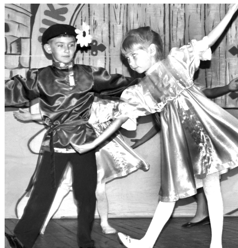
Фольклорная группа «Задоринка»