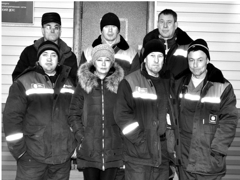
Коллектив Кыринского участка с командированными работниками Акинских РЭС

Сегодня мало кто представляет себе жизнь без электричества. Все, чем мы пользуемся дома и на работе: компьютеры, принтеры, холодильники, плиты, чайники и многое другое работает от электроэнергии.