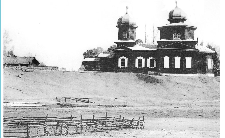
Вид на разрушенный ныне храм со стороны реки Кыры (компьютерное моделирование)