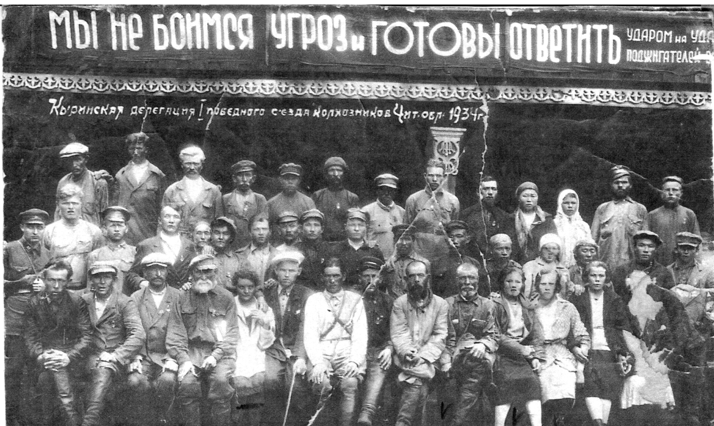
Кыринская делегация I слета колхозников Читинской области, 1934 год

До 1933 года числилось 23 колхоза, в том числе: им. 14-й годовщины Октября, «Крестьянин» (Кыра), «Борец за пушнину», «Красный партизан», «Охотник», «Хлебороб» (Бырца), им. Дзержинского (Букукун), им. Березнева (Быльра), «Партизанский охотник» (Кулинда), «Пограничник» (Алтан), им. Мологова (Мангут), «Забохотник», им. Богомолова (Ульхун-Партия), «Победа» (Тырин), «Путь Ильича» (Верхний Ульхун), им. Смолина, им. Калинина, им. Ленина, им. Сталина, им. Ворошилова, «Труд», «Пограничный охотник», коммуна «Победа» (Билтуй).