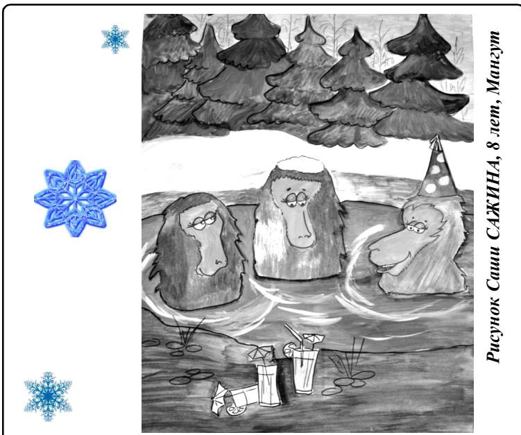
Рисунок Саши САЖИНА, 8 лет, Мангут