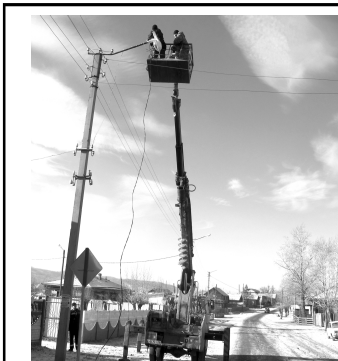
В Кыре зажглись фонари