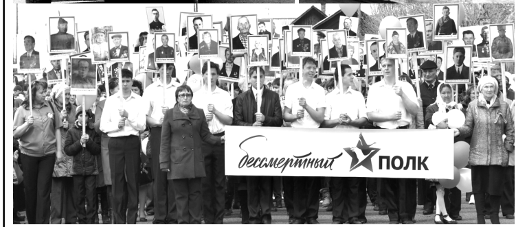
Празднование 70-летия Великой Победы