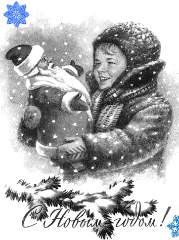
С Новым годом!

Расскажу о том, как я встретил первую елку в своей жизни. Мой отец, мастер пимокатного цеха, по состоянию здоровья вынужденный покинуть город, поступил работать в геологоразведку. После многих переездов мы