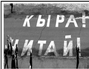
Флешмоб «Кыра! Читай!»