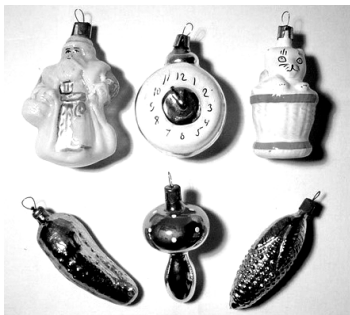
У кого сохранились такие игрушки?