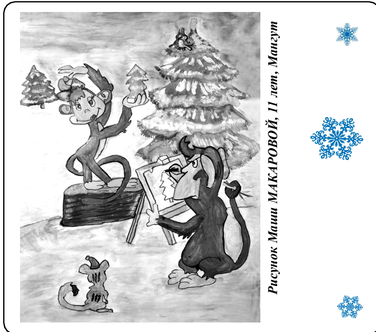
Рисунок Маши МАКАРОВОЙ, 11 лет, Мангут