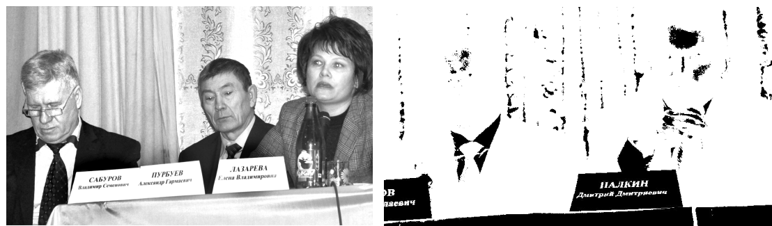
С отчетом о работе Правительства за 2014 год...