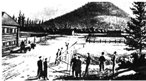
Н.П. Репин. Декабристы в Чите. Работы у впады. 1830-е гг.

28-29 января - 190 лет со времени прибытия первых декабристов в Читу (1827).