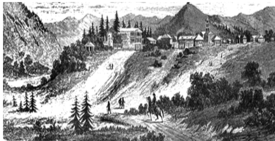
Собственный Е.И.В. Государя Императора Карийский золотой прииск

14 декабря - 80 лет со дня рождения поэта Р.В. Филиппова (1937-2006).