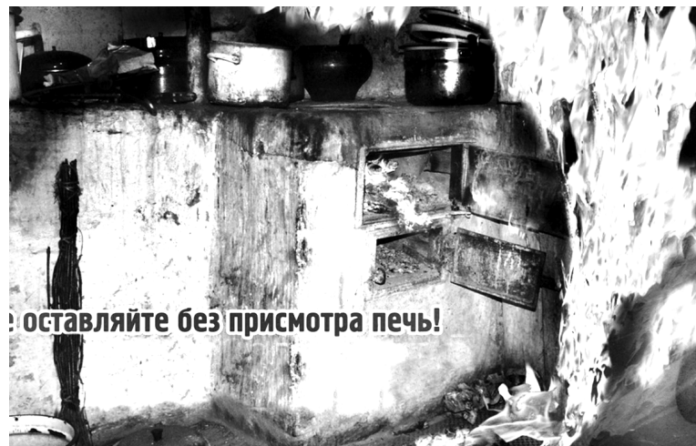
● оставляйте без присмотра печь!