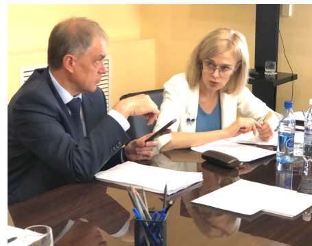
Спикеры от Забайкальского края в онлайн-формате озвучили предложения

Межрегиональная стратегическая сессия по вопросам здравоохранения, доступности жилья и авиаперевозок, цен на продукты в Дальневосточном федеральном округе состоялась на Камчатке по поручению зампреда Правительства Российской Федерации – полномочного представителя Президента Российской Федерации в ДФО Юрия Трутнева.