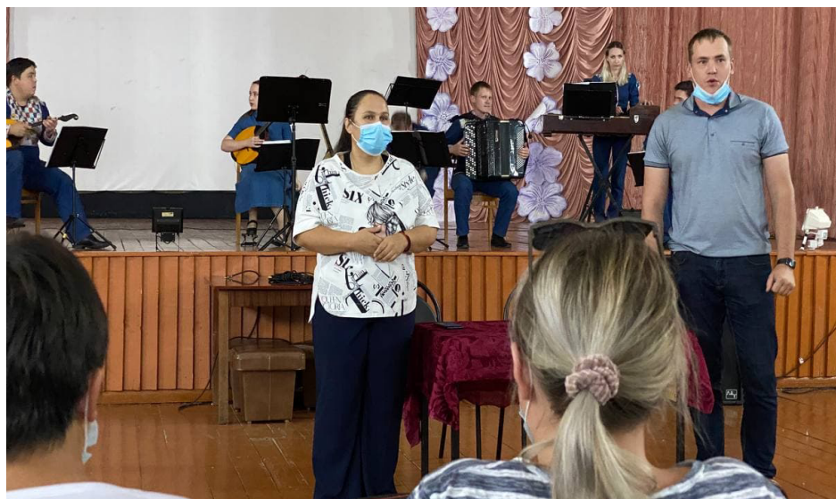
В Доме культуры села Мангут