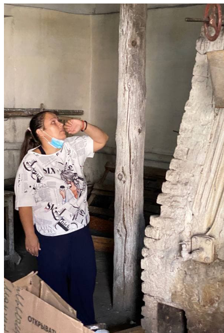
В централизованной котельной села Мангут

сия» по Даурскому одномандатному избирательному округу, руководитель регионального исполкома.