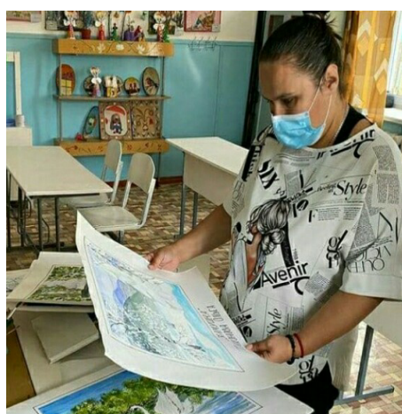
В детском саду села Тарбальджей