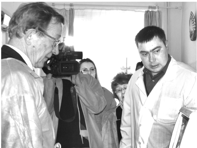
В Кыринской ЦРБ