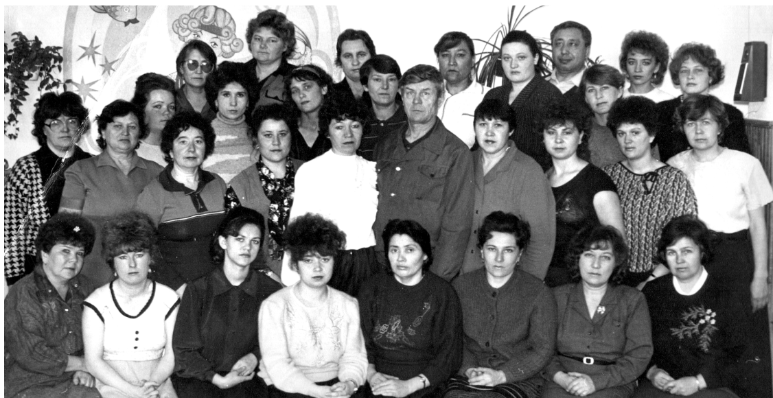
Коллектив детского сада «Буратино» 1989 года

года (в последующем категорийность отменили).