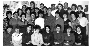
Все мы родом из детства