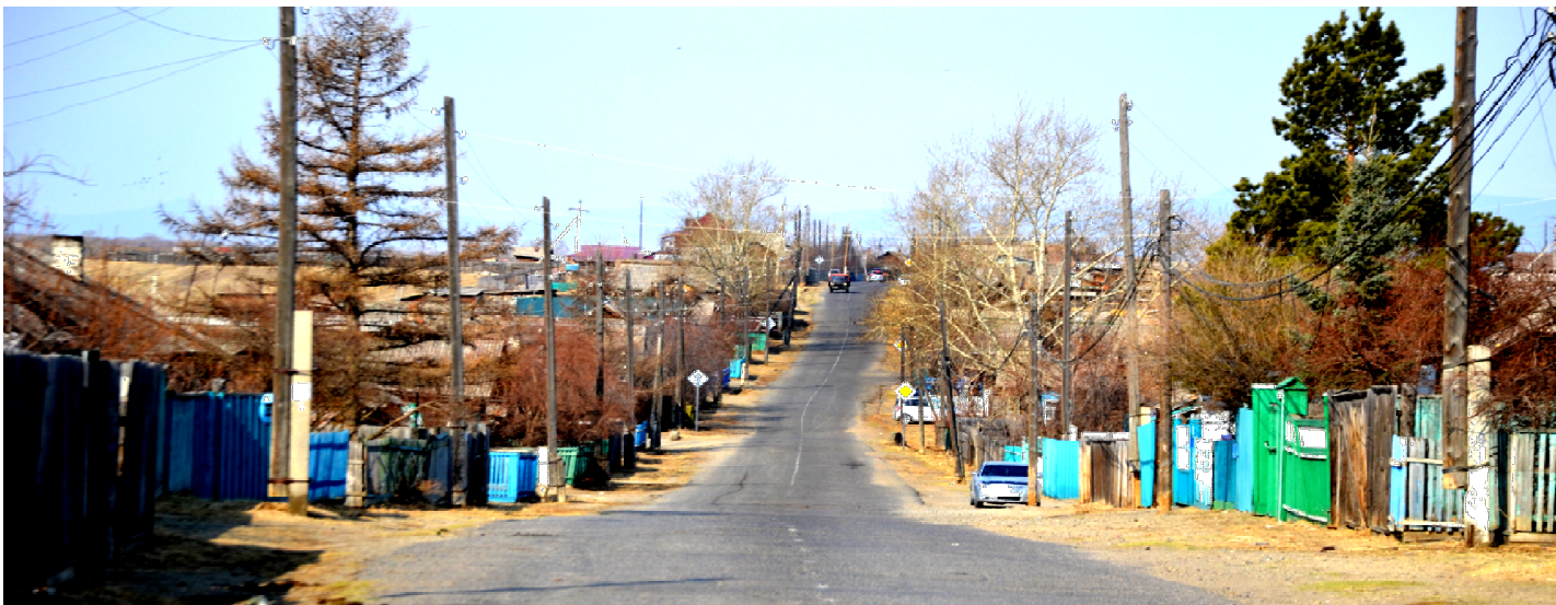
Вот так выглядела улица Комсомольская в Кыре 16 апреля около десяти утра. В следующем номере мы расскажем о том, как проходят рейды по соблюдению режима самоизоляции в районном центре

Будем рады оформить подписку по сниженным ценам! Также подписку можно оформить на сайте: https://podpiska.pochta.ru/ или в мобильном приложении «Почта России».