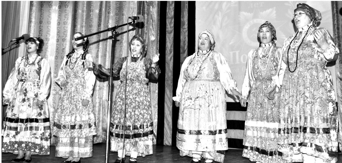
Фольклорная группа «Жемчужина»

ПРЕДСТАВИТЕЛИ не всех сел, к сожалению, смогли приехать в Кыру, хотя у многих были очень хорошие номера. Участвовали Алтанский и Мордойский филиалы, национально-культурный центр «Наследие» села Билотуй и РОМСКЦ.