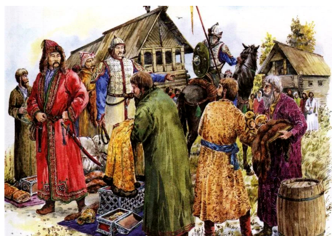
Во времена монголо-татарского ига учеты населения проводились для определения размеров дани

Учет в то время был хозяйственным: учитывались для обложения данью дома или «дымы». В XIV веке объектом обложения стали земельные участки, производительно используемые в хозяйстве – «соха» (позднее – «четверть», «десятина»). Составлялось так называемое сошное письмо, результаты описаний заносились в писцовые книги. В XVII веке единицей обложения стал двор, а основной формой учета – подворные переписи.