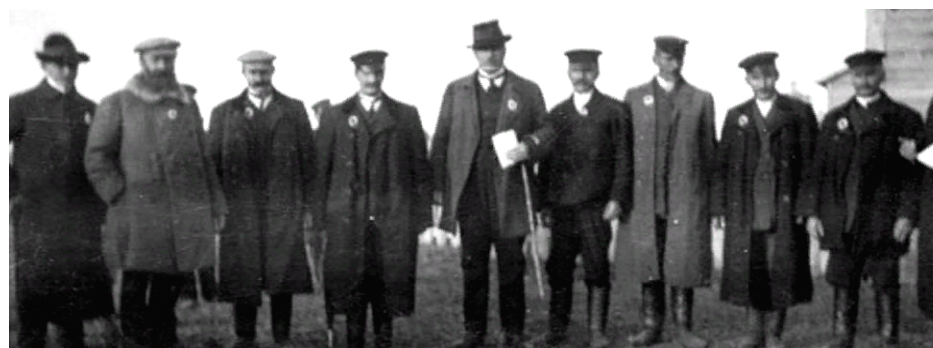
Группа учетчиков всеобщей переписи населения 1897 года

Составленные подобным образом списки («сказки») были собраны лишь через три года, а затем в течение следующих трех лет были подвергнуты проверке – «ревизии». С тех пор учеты населения в России стали называться «ревизиями податного населения» или просто «ревизиями». Такие ревизии проводились на протяжении почти полутора веков, вплоть до отмены крепостного права.