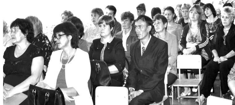
Участники педагогической конференции

Почётные грамоты Министерства образования и науки РФ