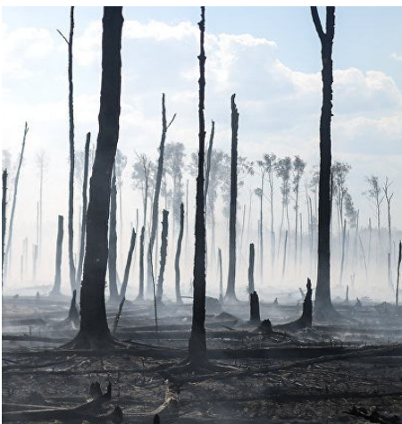
Пожар в лесу.

С. РЯСКИНА, мастер леса Алтанского лесничества