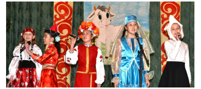
«Ононэй ургы»: песенно и вкусно