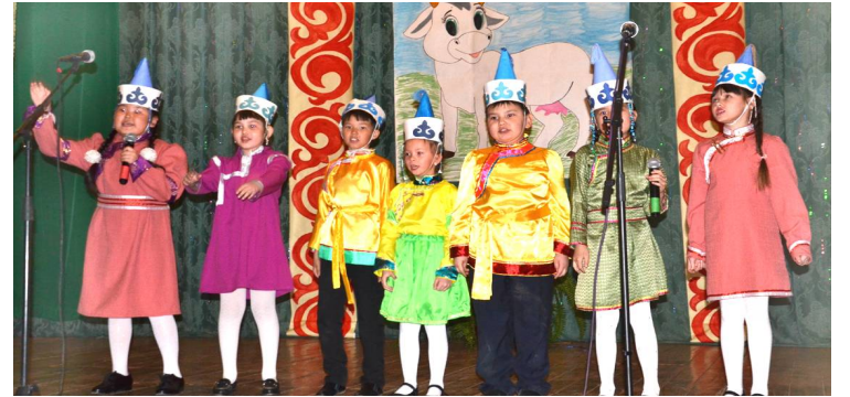
Детская вокальная группа (Ульхун-Партия)