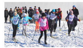
«Лыжня России» - 2021