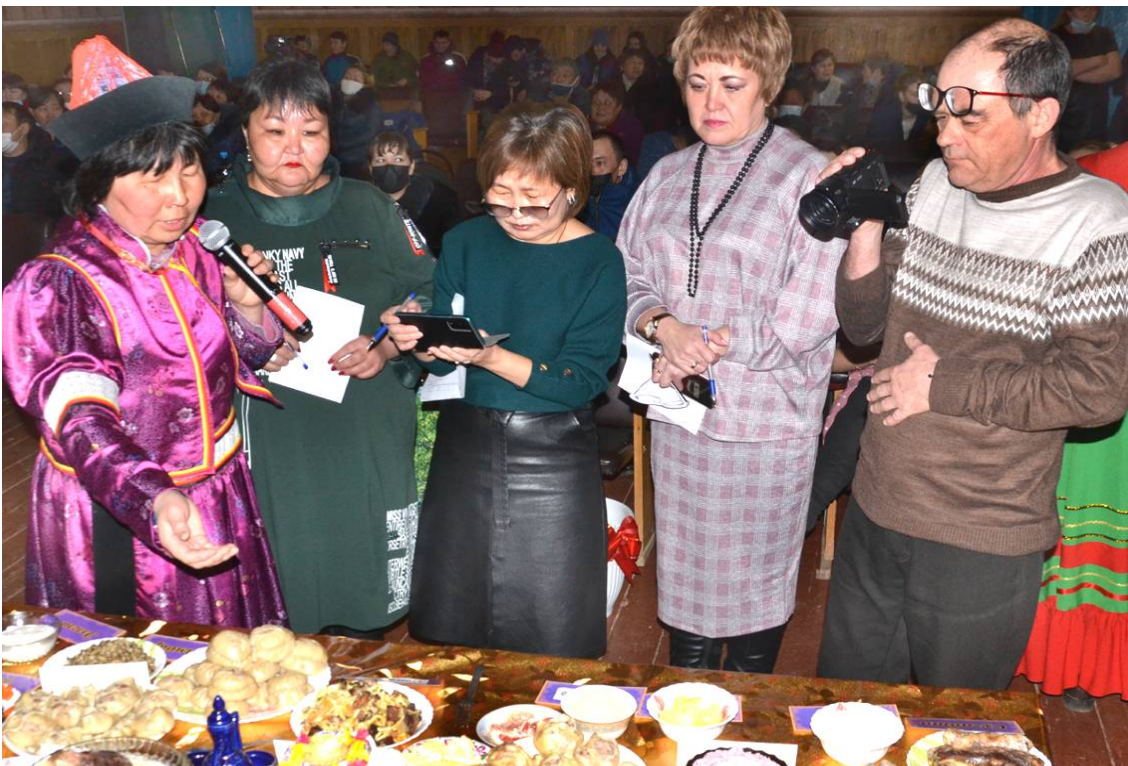
Жюри за работой