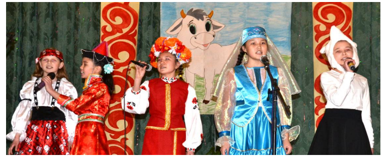
Детская вокальная группа «Улыбка» (Тарбальджей)

Объявляя концертные номера, ведущие старались кратко рассказать, о чем песня. Например, «Амар мендэ наран» переводится как «Здравствуй, солнце!» В песне есть такие слова: «Выглянуло солнце, засиял весь белый свет, воистину наш край стал еще прекраснее...» Или «Эжин найдал» – «Надежда матери» («Как красивый цветок я рос в вашем доме, прямой дорогой с вашего благословения я иду. Материнская надежда, материнское счастье в моем сердце, с ними я иду по жизни»). Или