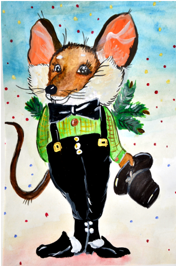
Рис. Вики ИГУМНОВОЙ, Мангут