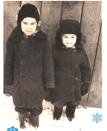
Люда с братишкой

ВСЕ мы родом из детства. И чем старше становимся, тем ярче воспоминания о нем. Есть среди них истории грустные и веселые, удивительные и приятные. Листаешь их в своей памяти, как яркие картины. Вот одна из них.