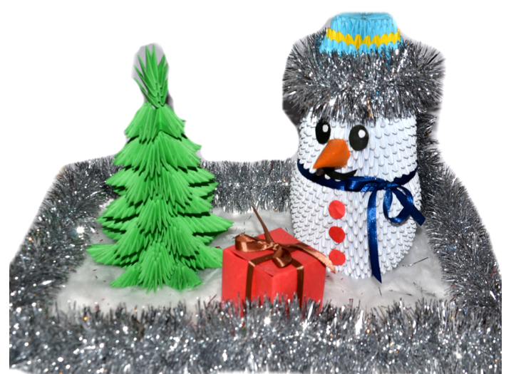
Поделка Эрдэма БАЛДАНОВА, Тарбальджей