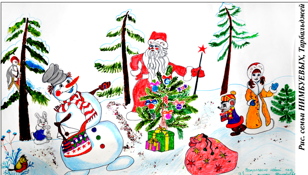
Рис. семьи НИМБУЕВЫХ, Турбальджей

• На Новогодний конкурс. Новогодняя шкатулка