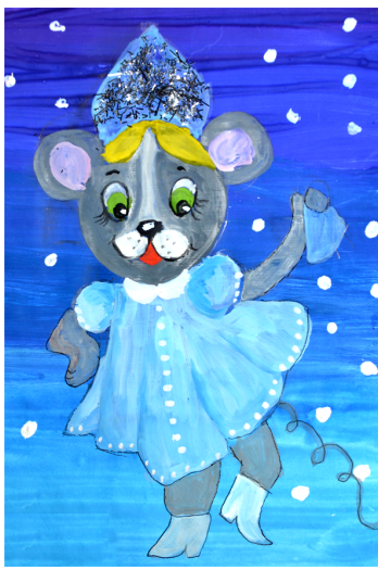
Рис. Светы МОИСЕЕВОЙ, Гавань