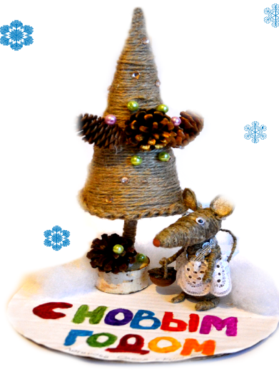
Поделка, Олеси ЛОГИНОВОЙ, Кыра