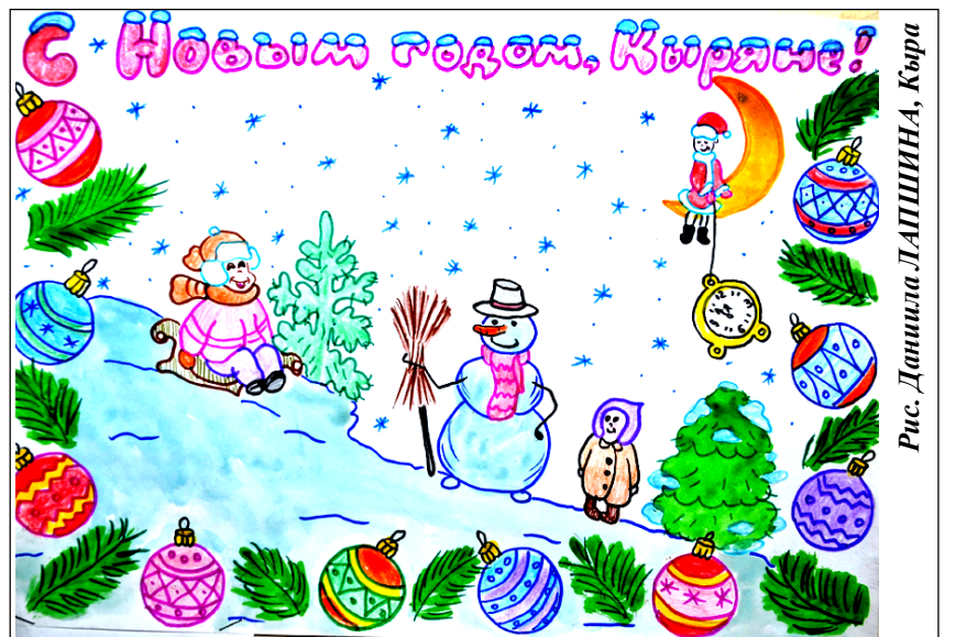
Рис. Данила ЛАПШИНА, Кыра