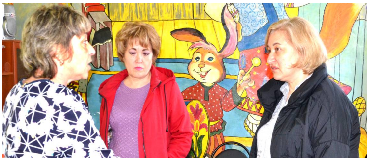
В районном Доме культуры