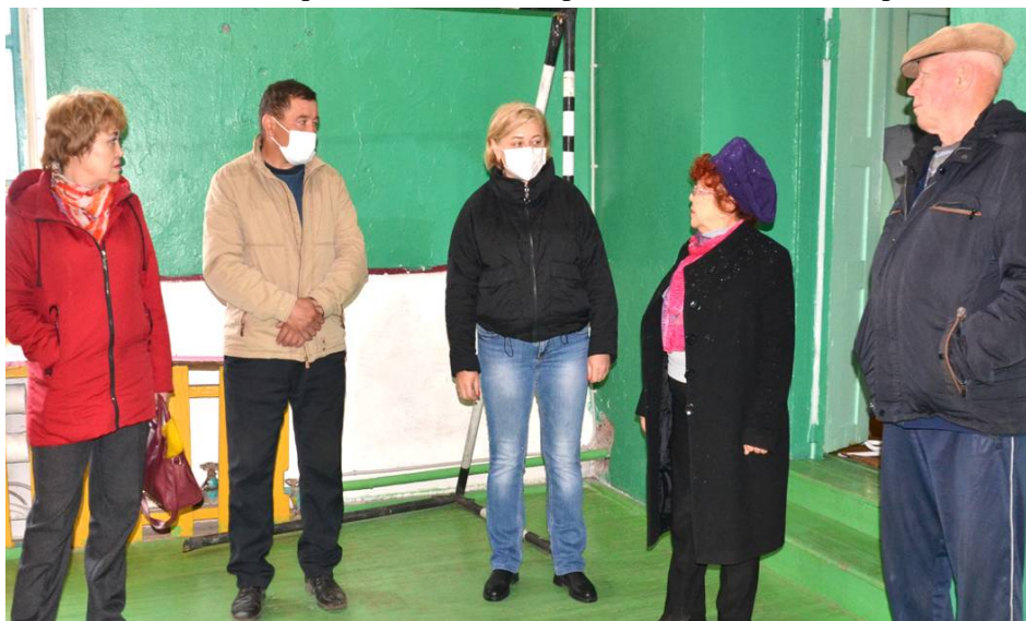
В детско-юношеской спортивной школе