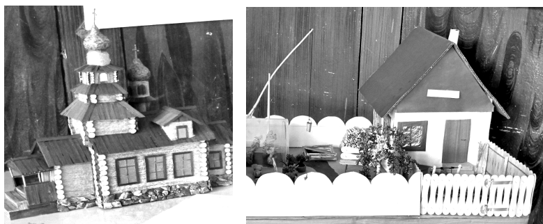
Работы участников конкурса «Край, в котором я живу»

В ПЕРВОМ конкурсе «История моей семьи в истории района» принимали участие школьники с 3 по 8 классы. Их сочинения были самые разные: о прапрадедушке-шахтере, прабабушке-учительнице, дедушке-механизаторе, бабушке-дойрке и бабушке - комсомольском лидере - о людях, внесших большой вклад в развитие нашего района.