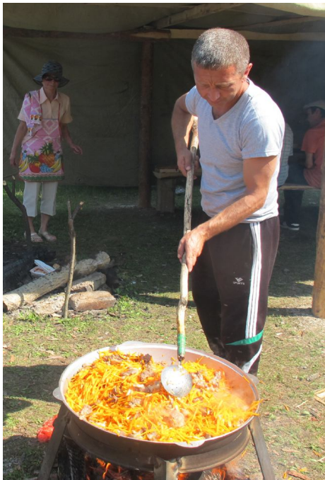
Плов удался на славу