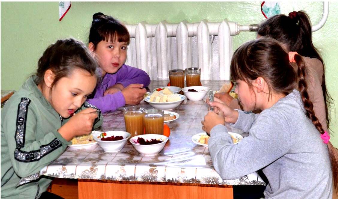
На кухне и в столовой Кыринской школы