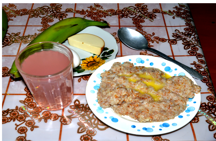
В пятницу – ячневая каша, вареное яйцо, хлеб, сыр, кисель и банан

и уютной. Не припоминаю ни одного дня, когда я была в школе голодной. На большой перемене мы, дождавшись своей очереди, забежали, брали свою порцию и уплетали ее буквально за пару минут. Каждый раз это было что-то новенькое. Сейчас же, на мой взгляд, питание стало еще лучше. Уж насколько вкусно мы готовим дома, но это уж точно не сравнится со школой. Некоторые каши и супы я так вкусно вообще бы приготовить не смогла!