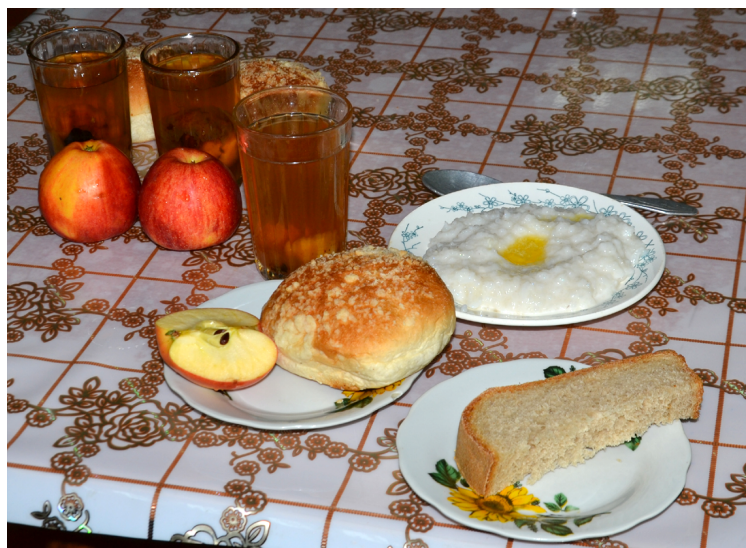
В среду в меню были рисовая каша, хлеб, компот, булочка и треть яблока