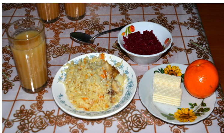
В четверг – плов, свекольный салат, хлеб, сок, вафли и мандарин