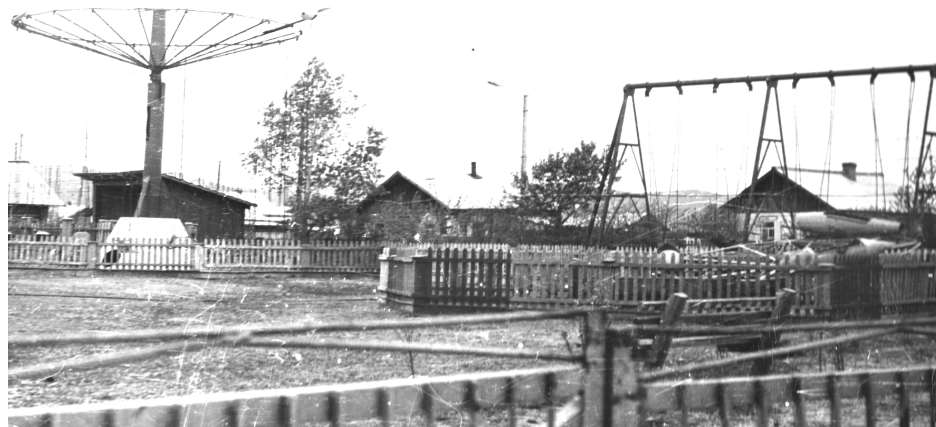
Парк отдыха, 70-ые годы

овец, свиноводы. Увеличивались посевные площади, поднималась целина. Работа кипела повсюду. В самой Кыре открывались новые предприятия и учреждения. В Кыре работали кинотеатр, комбинат бытового обслуживания, строительные организации, маслозавод, райтопсбыт, лесхоз, лесспромхоз, геологоразведка, районное потребительское общество.