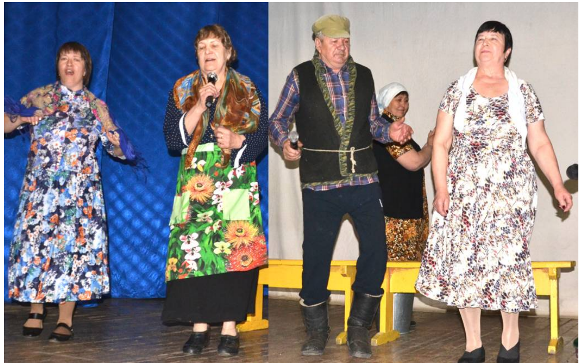
Комитет образования, ДЮСШ и Дом творчества