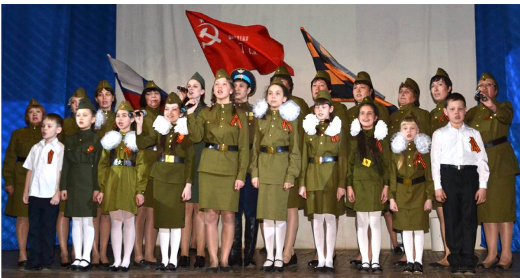
Районная библиотека и краеведческий музей