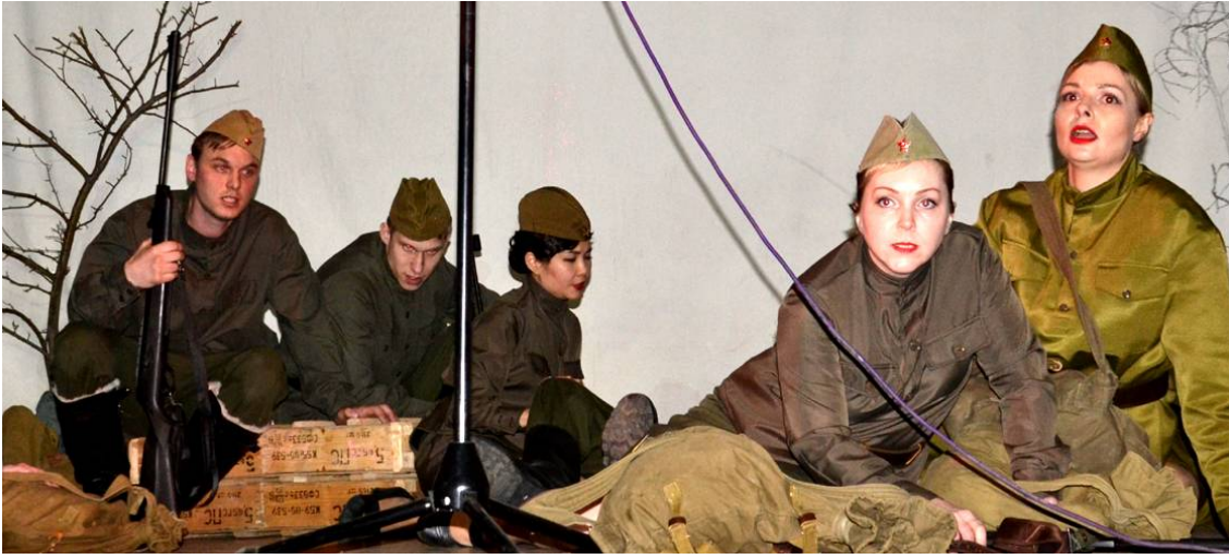
Служба в селе Мангут