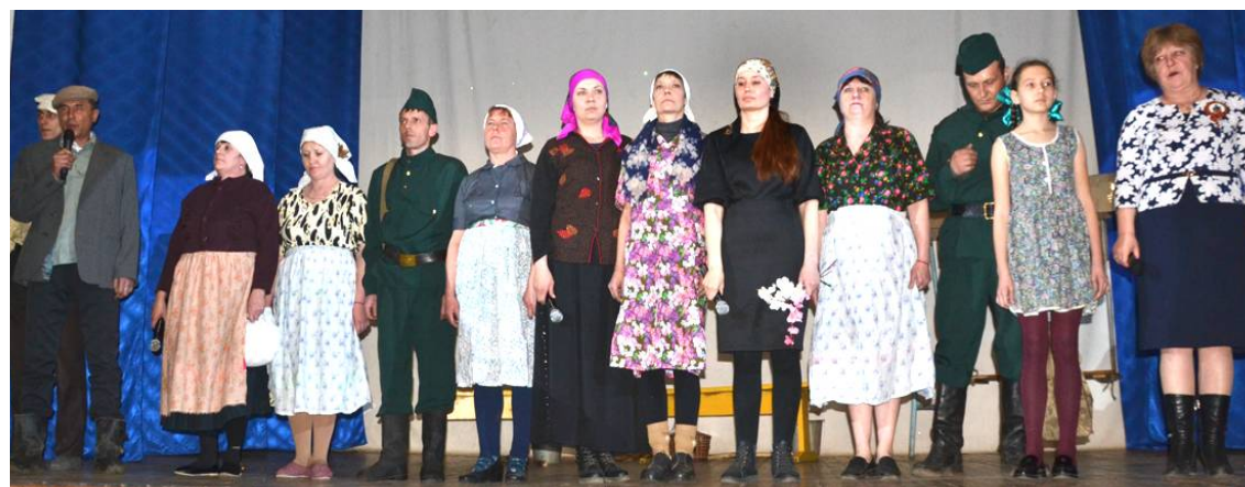
Кыринское почтовое отделение и филиал ПАО «Ростелеком»

Сразу скажу, что итогов смотра в этом материале не будет, их торжественно объявят 8 мая.