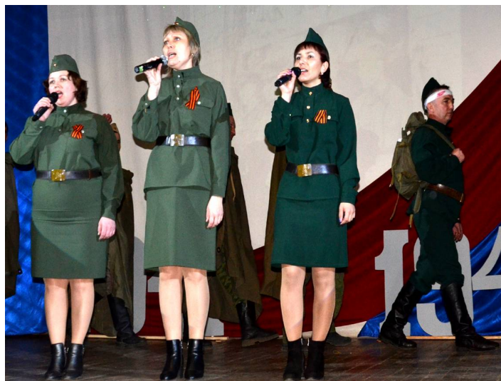
Администрация района, СП «Кыринское», комитет по финансам