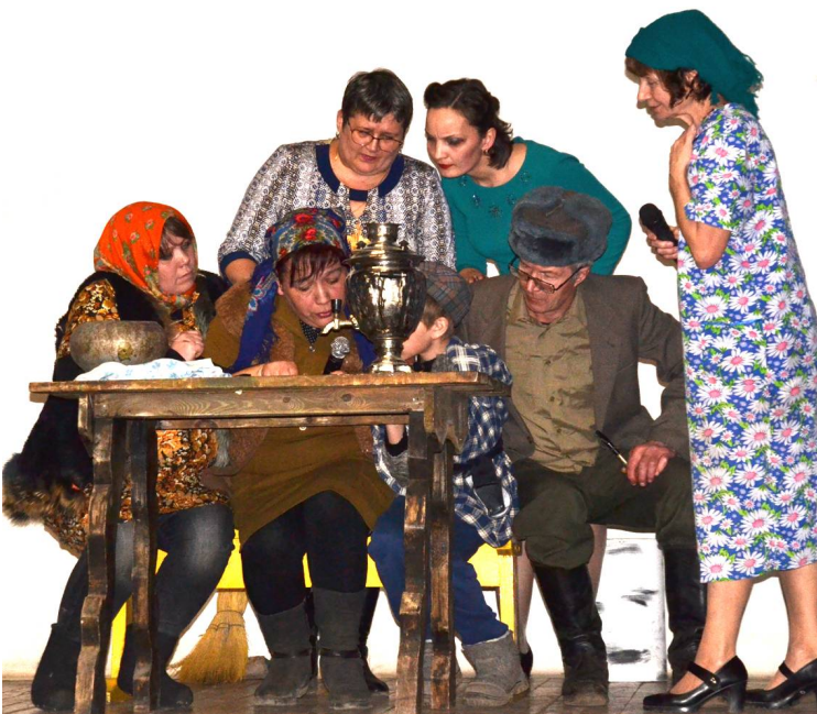
Детская школа искусств