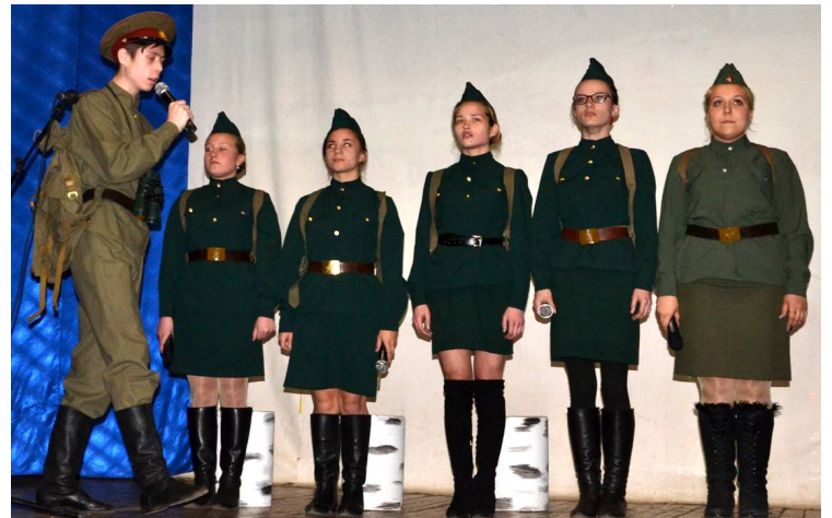
Кыринская вечерняя школа