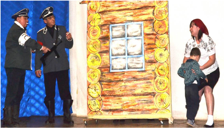
СРЦ «Перекресток», ЦЗН и отдел соцзащиты