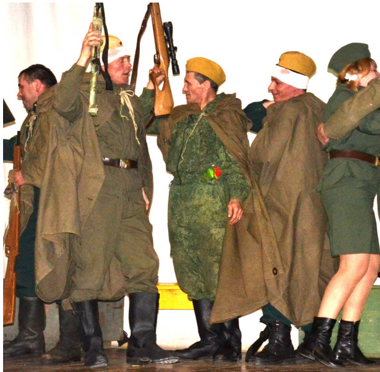
Пожарная часть № 23