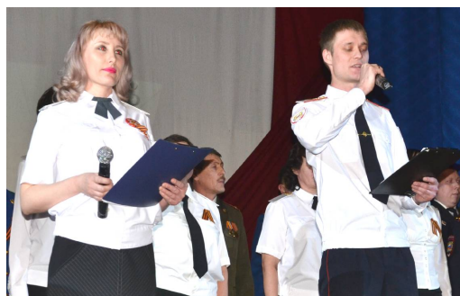
Прокуратура, районный суд, полиция и военкомат

Очень живым стало выступление учителей и учеников Кыринской средней школы, которые ярко продемонстрировали, как для поддержания боевого духа прямо между боями профессиональные артисты устраивали для бойцов концерты. Более 3500 артистических бригад работало на фронте, в них было занято 42 тысячи работников, а среди них такие звезды как Лидия Русланова, Тарапунька и Штепель, Клавдия Шульженко... Советские люди умели не только воевать, но и весе-