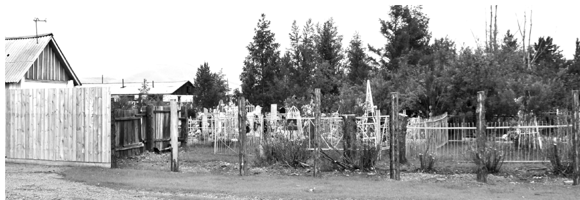
Жителей Кыры беспокоит, что кладбище разгорожено, и там гуляет скот