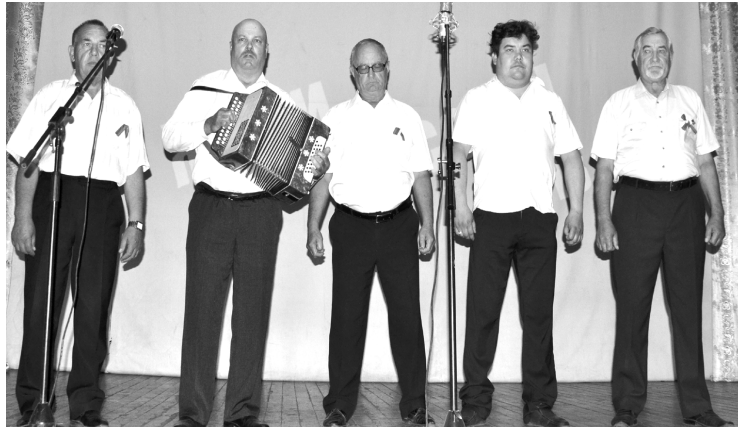
Мужская вокальная группа акшинского хора «Елань»