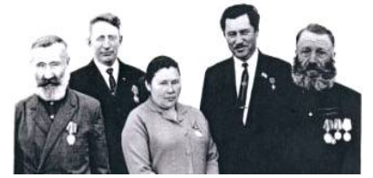
Местные советы после войны