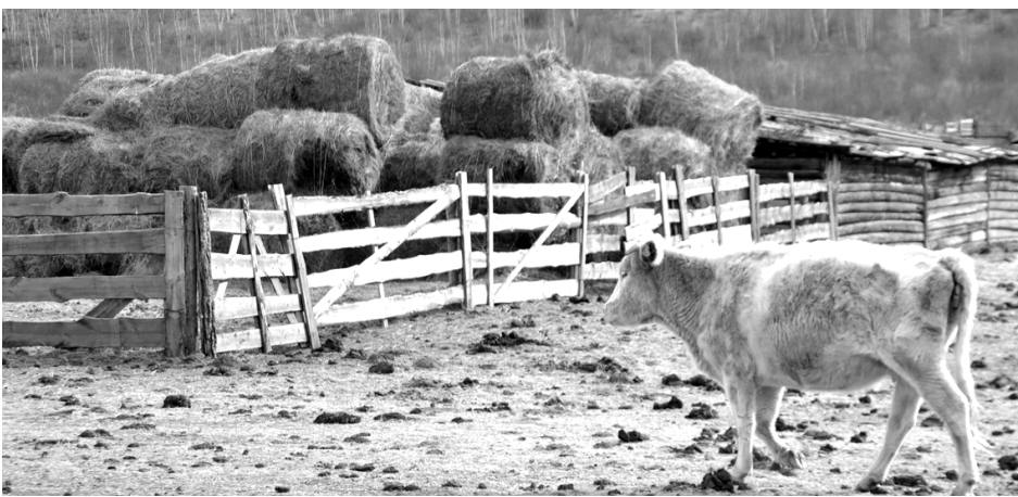
На ферме «Енда»