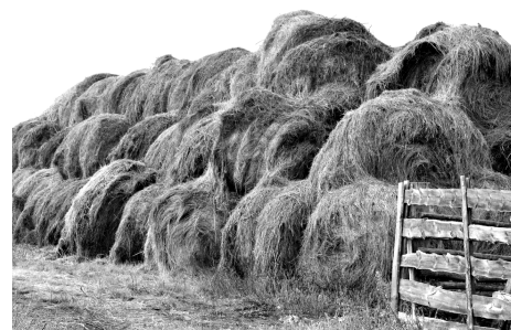
Запас кормов в бригаде Виктора Казанцева, СХПК «Луч»

С КОРМАМИ дело обстоит немного лучше. При плане заготовки на район в 41037 тонн сена заготовлено 32135 тонн (или 78 процентов от плана), из них 5916 тонн заготовили сельхозпредприятия и фермеры, остальное, 26219 тонн, - личные подсобные хозяйства. Также по району заготовлено 203 тонны зеленки, 32 тонны зернофуража, 48 тонн соломы.