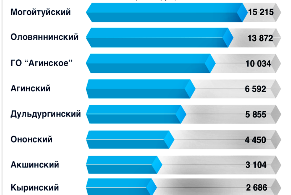
Задолженность по имущественным налогам физических лиц в разрезе районов на 19 декабря 2018 года (в тыс. руб.)

Межрайонная ИФНС России №1 по Забайкальскому краю