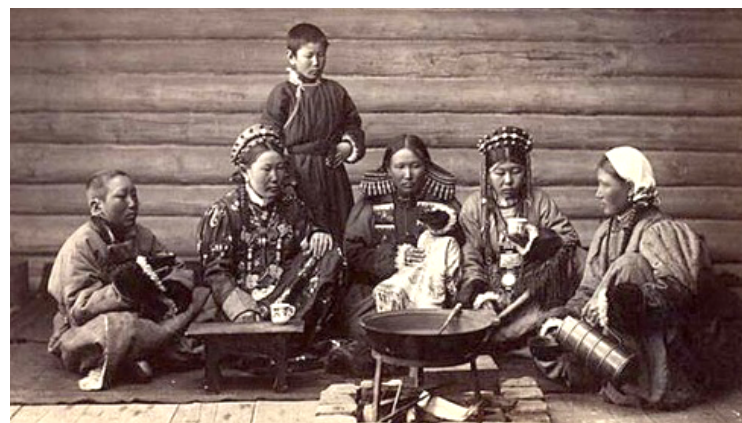
Бурятская семья. Снимок 1910 года.